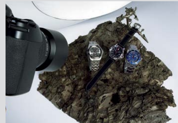
Jedes Sujet wirkungsvoll in Szene gesetzt.